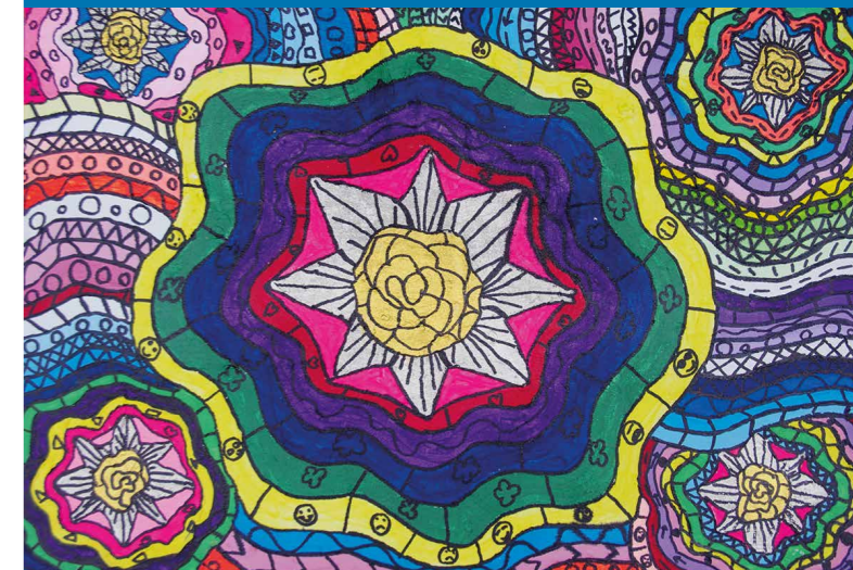
Das Leben der Farbenfröhlichkeit, Aljoscha Meise